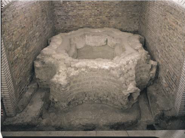
Die Piscina östlich des Domchores – letzter Rest der Kirchenanlage des 6. Jh. n. Chr.

Zweitens: die Infrastruktur der Stadt, Straßen und Abwassersystem, wurde auch noch im späten 4., ja sogar noch im 5. Jh., erneuert, nachdem die letzten staatlichen römischen Autoritäten das Rheingebiet verlassen hatten. 29 Fränkische Könige übernahmen die Stadt und ließen sich im Praetorium nieder.