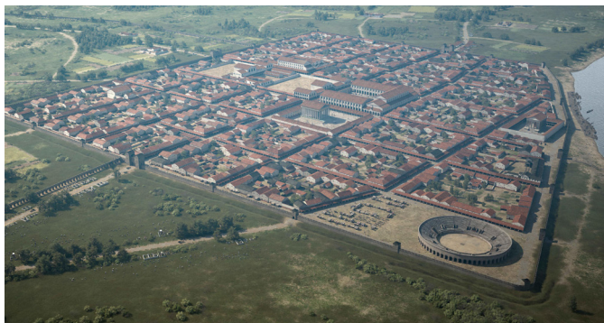
Zu sehen ist die virtuelle Ansicht der Colonia Ulpia Traiana aus der Vogelperspektive.

Der LVR-Archäologische Park Xanten mit Römermuseum bewahrt die Reste der zweitgrößten römischen Stadt im Rheinland, der Colonia Ulpia Traiana (CUT). Doch im Unterschied zum größeren Köln und allen anderen Römerstädten nördlich der Alpen wurde die CUT nie flächendeckend überbaut.