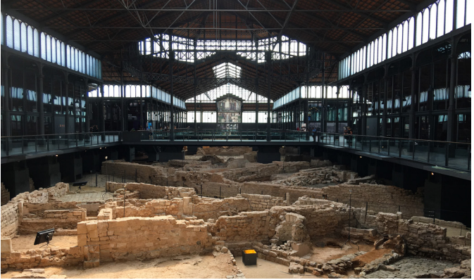
Das Archäologische Quartier El Born Centre Cultural in Barcelona.

Die Präsentation archäologischer Denkmäler findet in verschiedenen Kategorien statt. Dies können archäologische Landschaftsparks, archäologische Museen, Schutzbauten oder offene Ausgrabungsbe- reiche sein.