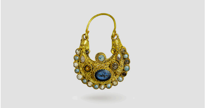
Gefunden im Viertel: ein mittelalterlicher Ohrring.

Handwerk vom Feinsten: Zu den Ausgrabungen im MiQua gehören Teile des mittelalterlichen Goldschmiedeviertels. Und auch einige Funde erzählen Schmuckgeschichte. Erfahren Sie mehr dazu, was gefunden wurde – und gestalten Sie als Souvenir einen modernen Modeschmuck-Ohrring.