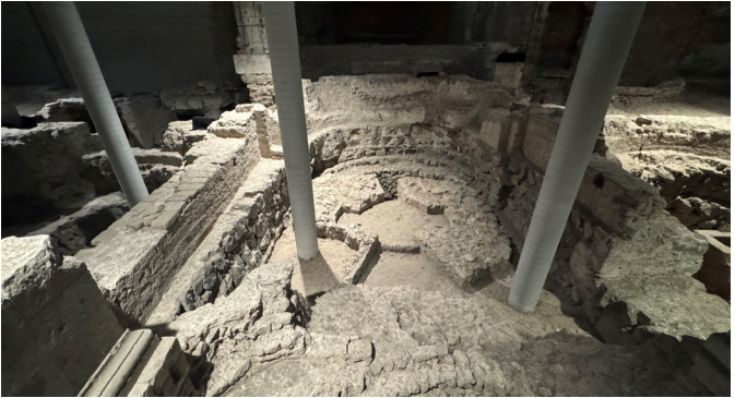
Ausgrabungen unter der Kirche St. Kolumba, erhalten im Museum KOLUMBA.

Neben den in dieser Vortragsreihe schon präsentierten Kirchen St. Severin (1), dem Dom (2), St. Pantaleon (3) und St. Gereon (4) besitzen auch die hier vorgestellten Kölner Kirchenbauten ältere Bautraditionen. Das kann z. B. eine ganze Kirchengrabung mit zahlreichen Bauphasen sein, wie im Falle von St. Ursula, oder es sind nur wenige Bauspuren aus dem Frühmittelalter wie bei der St. Maria im Kapitol. Alle Bauten gehören aber zum Umfeld des im Frühmittelalter weiter genutzten Praetoriums.