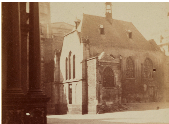
Rathausplatz mit Ratskapelle.

Mit dem Einmarsch französischer Truppen in Köln im Jahr 1794 endet die mehr als 300-jährige Nutzung der Ratskapelle durch den Rat der Stadt. Das Gebäude wird entweihet, der Kirchenschatz veräußert. Infolgedessen erfährt die Kapelle wechselnde Nachnutzungen: Sie dient als städtisches Depot, droht zu verfallen und wird über die Jahre verschiedenen Vereinen und Konfessionen zur Verfügung gestellt. In den Bombennächten des Zweiten Weltkriegs brennt die Kapelle aus und wird schließlich vollkommen zerstört. Der Wiederaufbau des Rathausplatzes erfolgt ohne die Ratskapelle, ihre Geschichte bleibt im Stadtbild unsichtbar.